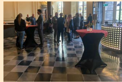
Journées d'information organisées pour nos partenaires allemands